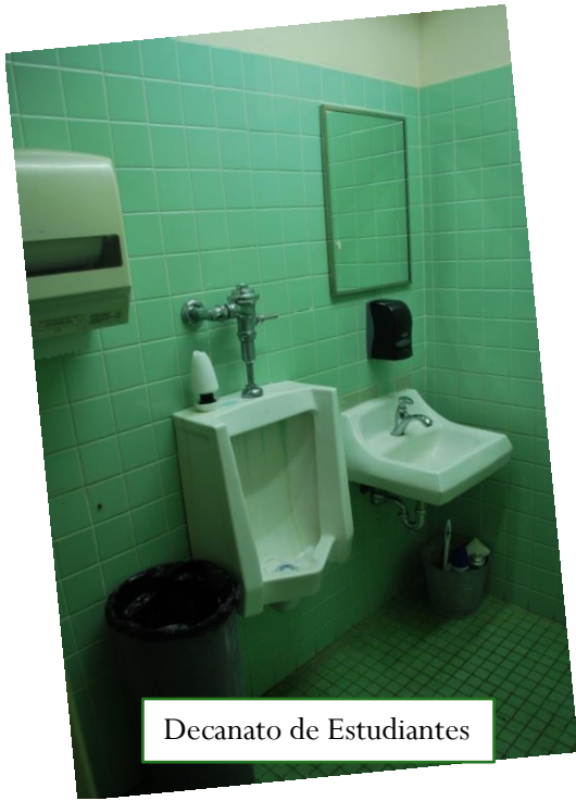
Decanato de Estudiantes