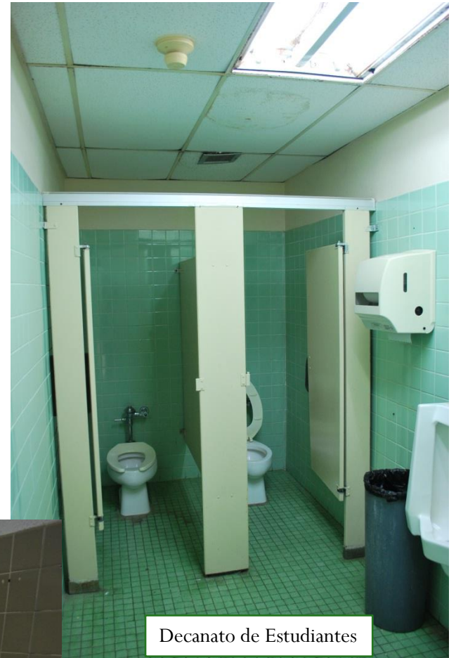
Decanato de Estudiantes