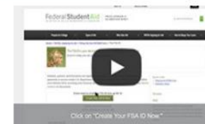
Cómo crear una credencial FSA ID